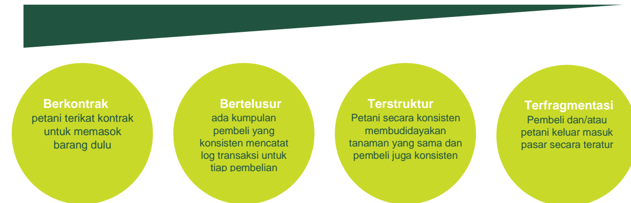
Diagram di bawah ini menyajikan struktur rantai nilai pada spektrum dari pertanian kontrak, pengaturan paling terstruktur, sampai ke rantai “terfragmentasi” yang pada dasarnya tidak terstruktur.

Di luar rantai nilai itu sendiri, tren yang lebih luas dalam pemanfaatan teknologi—dari penggunaan ponsel dan dompet secara pribadi, internet, dan media sosial sampai satelit cuaca dan sensor jarak jauh—menciptakan “jejak digital” para petani yang hingga kini bahkan belum “terpetakan” di antara sebagian besar kreditur (kecuali jika ditampilkan di hadapan mereka, dengan biaya besar, melalui kunjungan langsung ke lahan). Panduan ini juga menilik sejumlah data inovatif lain yang dapat dikumpulkan dari petani dari jarak jauh menggunakan perangkat digital.